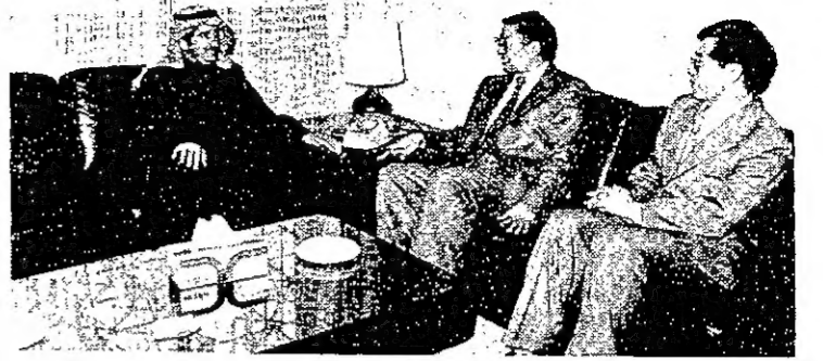
... ولدى استقباله سفير الصين

استقبل وزير الشؤون الاجتماعية والعمل خالد الجميمان مكتبه على التوالي كلا من ابو الكلام محمد نذر الاسلام سفير جمهورية بنغلادش ويايانغ فو تشانغ سفير جمهورية الصين الشعبية لدى الكويت.